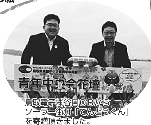
鳥取電子鉄谷口OBから ソーラー街灯「てんとうくん」 を寄贈頂きました。