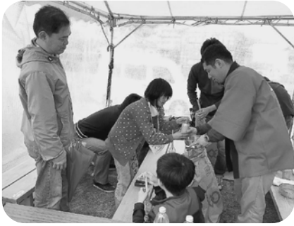
お仕事体験 Tザニア