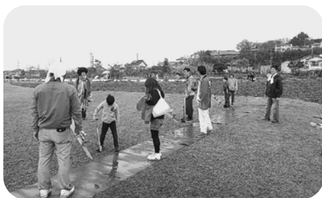
ペットボトルロケット