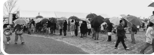
しじみ汁 無料配布